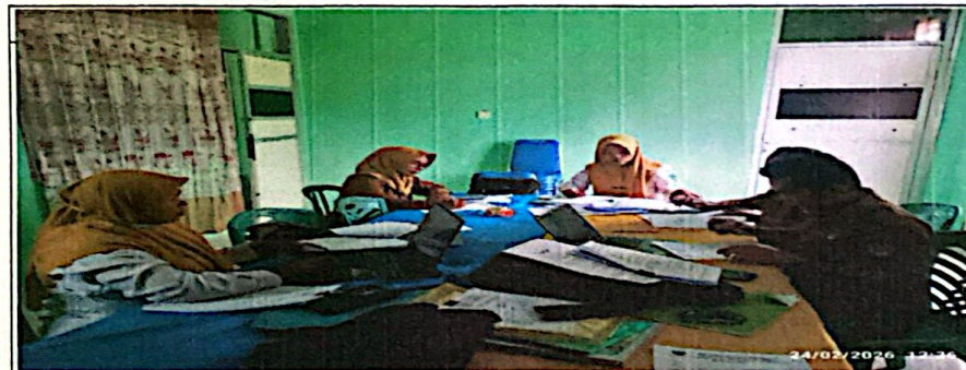
Pembahasan Dokumen APBNagari Tahun Anggaran 2026 antara Nagari Tigo Sungai Inderapura dengan Tim Evaluasi Tk. Kecamatan