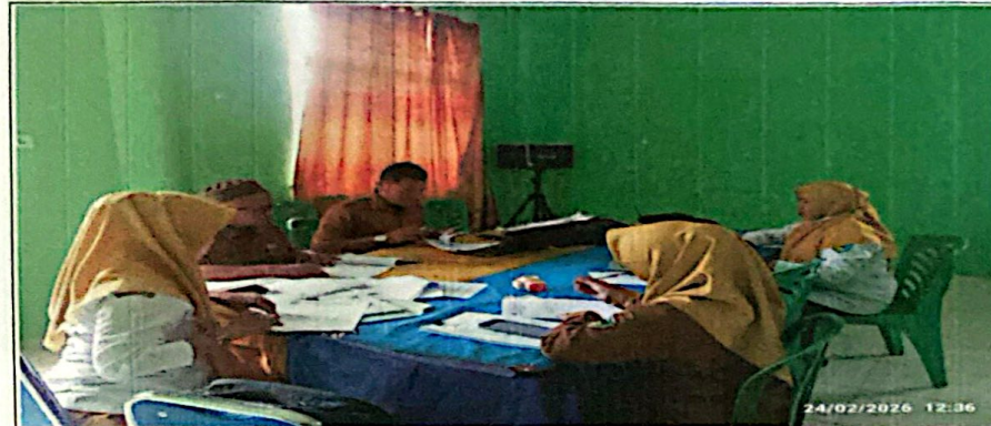
Pembahasan Dokumen APBNagari Tahun Anggaran 2026 antara Nagari Tigo Sungai Inderapura dengan Tim Evaluasi Tk. Kecamatan