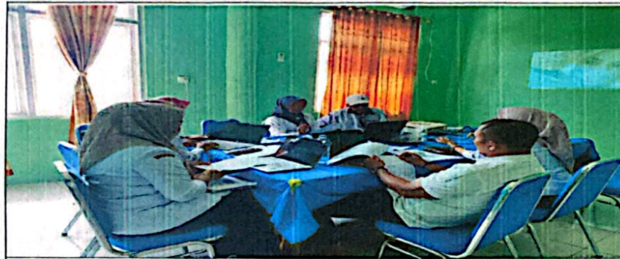
Pembahasan Dokumen APBNagari Tahun Anggaran 2026 antara Nagari Tiga Sepakat Inderapura dengan Tim Evaluasi Tk. Kecamatan