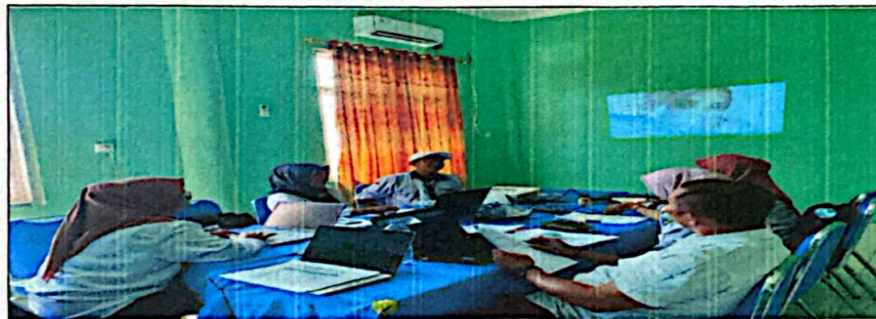
Pembahasan Dokumen APBNagari Tahun Anggaran 2026 antara Nagari Tiga Sepakat Inderapura dengan Tim Evaluasi Tk. Kecamatan