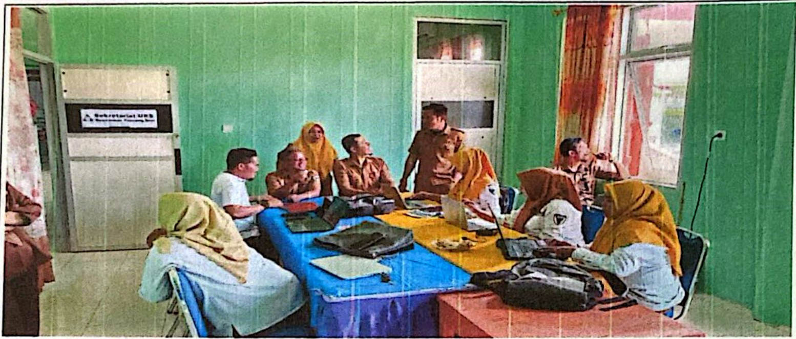
Pembahasan Dokumen APBNagari Tahun Anggaran 2026 antara Nagari Inderapura Barat dengan Tim Evaluasi Tk. Kecamatan