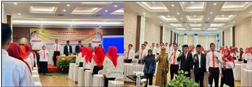
Gambar 1. Dokumentasi Kegiatan Latsar CPNS

Pelatihan Dasar (Latsar) adalah program pelatihan fundamental untuk membekali CPNS dengan pengetahuan, keterampilan, dan sikap dasar sesuai bidangnya, paling dikenal sebagai syarat wajib CPNS (Calon Pegawai Negeri Sipil) untuk menjadi PNS, namun juga ada untuk militer, organisasi, atau keterampilan digital, yang bertujuan membentuk kompetensi inti dan karakter profesional. Program pelatihan ini memadukan teori dan praktik ( blended learning ) serta membangun wawasan kebangsaan, nilai dasar ASN (Ber-Akhlak), dan kompetensi teknis agar mampu mengabdikan secara profesional.