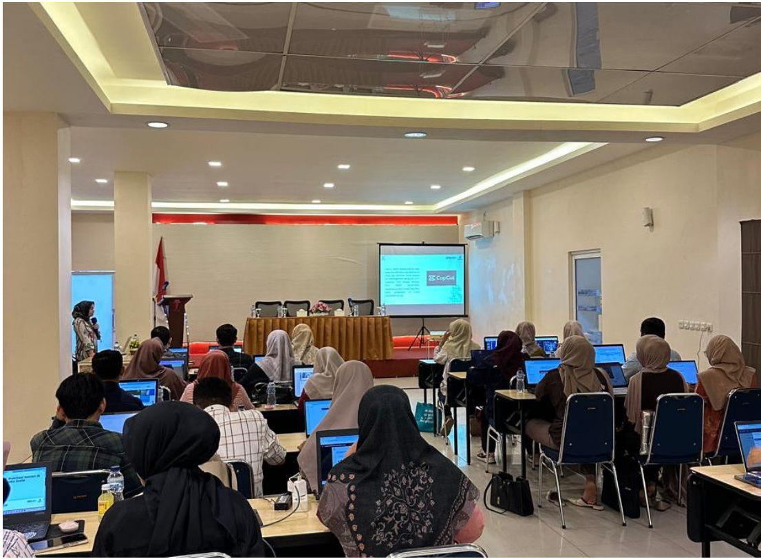
Foto kegiatan Penutupan Pelatihan “ Government Transformmmation Academy ” tema AI For Content Creation Pada Tanggal 6 Desember 2025