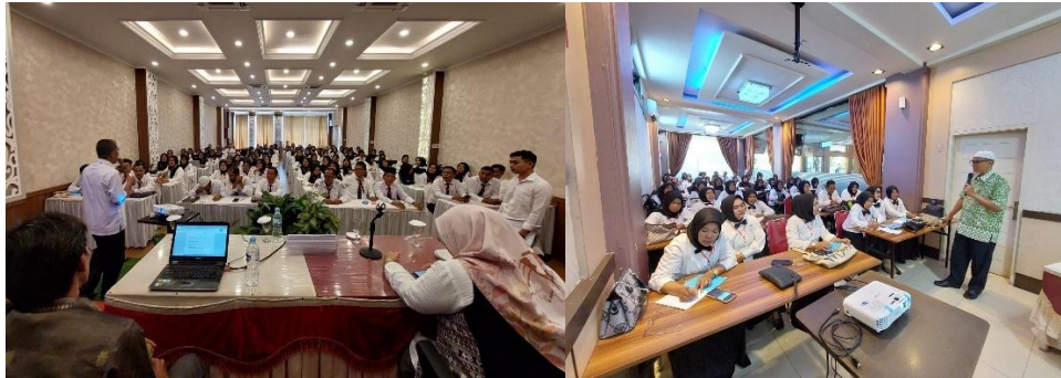
Gambar 1. Proses Pembelajaran Kegiatan Orientasi PPPK

Orientasi wajib diikuti oleh semua Pegawai Pemerintah dengan Perjanjian Kerja yang baru diangkat dan bertujuan untuk memperkenalkan nilai-nilai, tugas, dan fungsi Aparatur Sipil Negara kepada Pegawai Pemerintah dengan Perjanjian Kerja. Orientasi ini penting dilakukan mengingat latar belakang Pegawai Pemerintah dengan Perjanjian Kerja yang berasal dari non Aparatur Sipil Negara tentunya memerlukan pemahaman tentang nilai dan fungsi Aparatur Sipil Negara sebelum terjun ke lingkungan birokrasi pemerintahan.