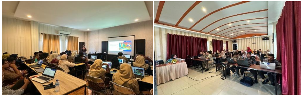
Gambar 2. Dokumentasi Kegiatan Pelatihan GTA

Pelatihan Government Transformation Academy (GTA) yang diselenggarakan oleh Kementerian Kominfo memberikan pelatihan untuk ASN, TNI dan Polri untuk mendukung transformasi digital pemerintahan di Kementerian/ Lembaga/ Pemerintah Daerah. Pemerintah Kabupaten Pesisir Selatan di Tahun 2025 mendapat kesempatan untuk menyelenggarakan tema pelatihan, yaitu “ Artificial Intelligence (AI) for Content Creation ”.