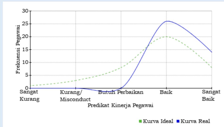
KURVA DISTRIBUSI PREDIKAT KINERJA PEGAWAI DENGAN CAPAIAN KINERJA ORGANISASI BAIK