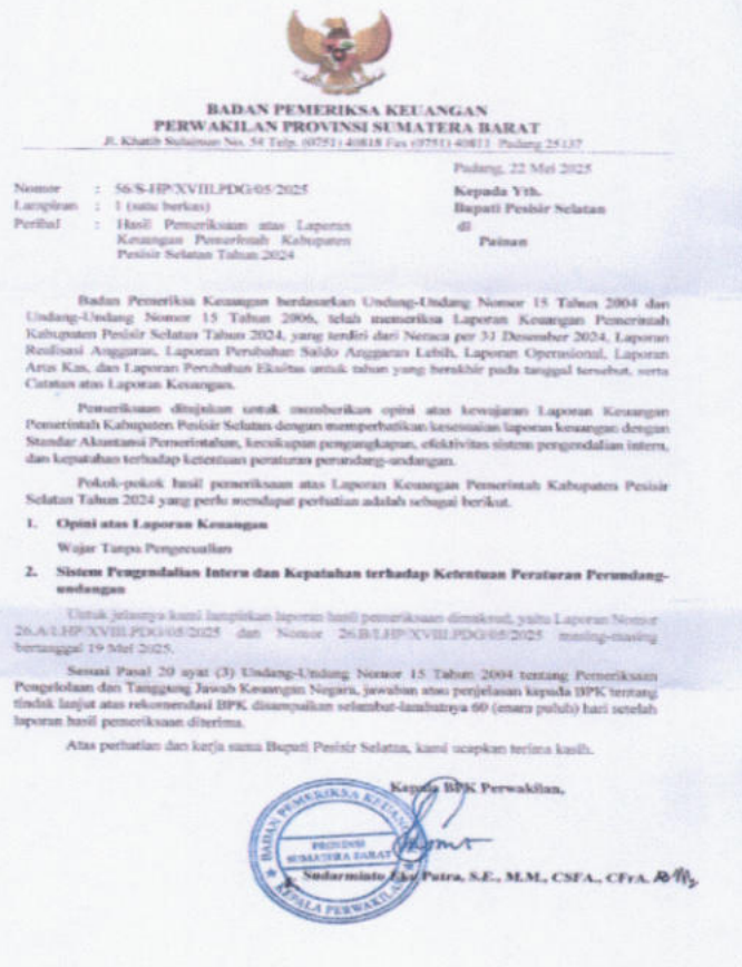
Gambar 2.1 Pernyataan dan Dokumentasi WTP Tahun 2024