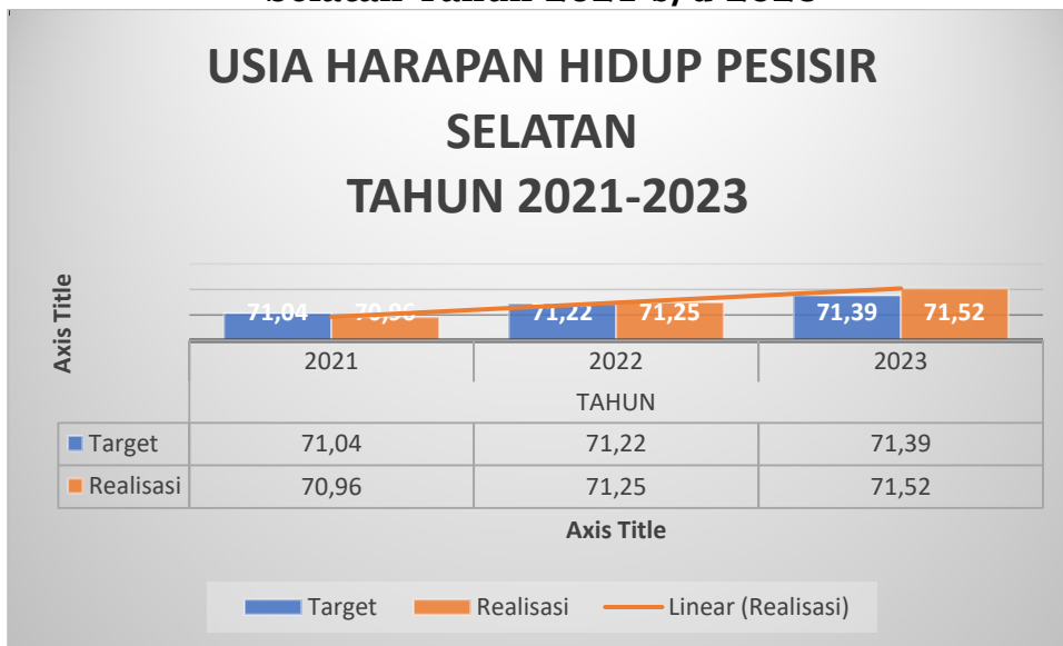
Tabel 2. 3 Target dan Capaian Usia Harapan Hidup Kabupaten Pesisir Selatan Tahun 2021 s/d 2023

Dari tabel diatas dapat dilihat pencapaian Usia Harapan Hidup di Kabupaten Pesisir Selatan mengalami peningkatan pada tahun 2023 dengan target 71,39 terealisasi sebesar 71,52, dibandingkan dengan target dan realisasi pada tahun 2022 yaitu 71,22 dan 70,25. Dengan capaian ini artinya kabupaten Pesisir Selatan telah melampaui target yang telah ditetapkan. Ini juga menunjukkan bahwa dalam tiga tahun terakhir terjadi peningkatan derajat kesehatan masyarakat