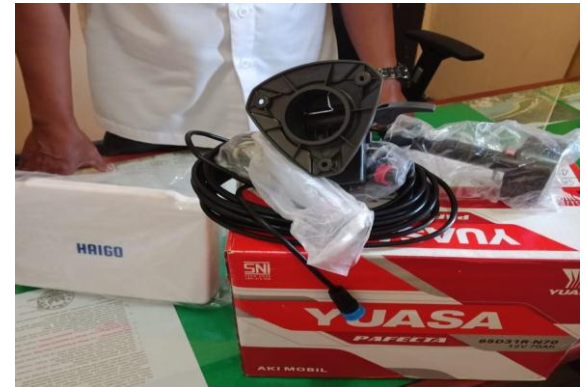
Penyerahan Fish Finder