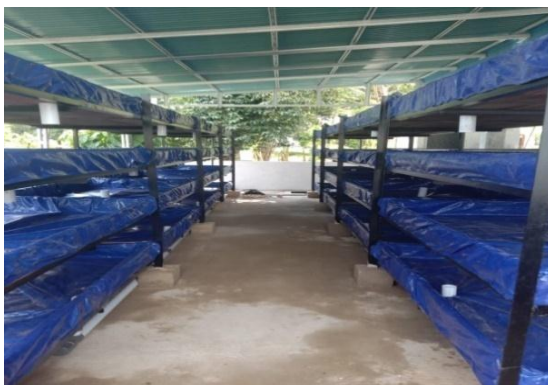
Budidaya Pakan Alami