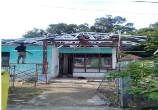
Rehabilitasi Rumah jaga BBI