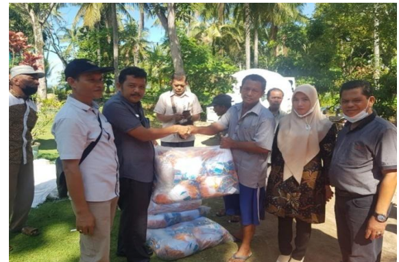
Alat Tangkap Jaring Nelayan (Trammel Net)