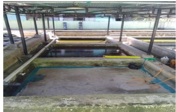
Rehabilitasi Kolam Pemijahan