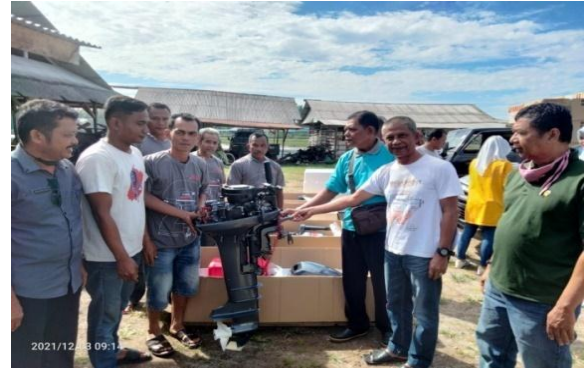
Penyerahan Mesin Tempel 15 PK