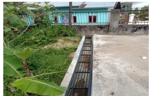
Rehabilitasi Saluran Air Pasok (Masuk) dan Buang (Keluar)