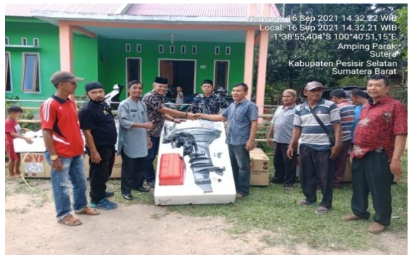
Penyerahan Mesin Tempel 40 PK