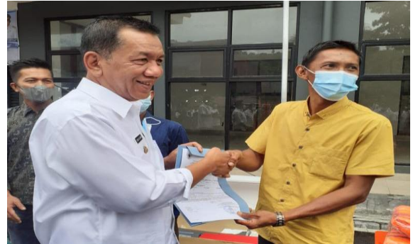
Penyerahan Pas Kecil